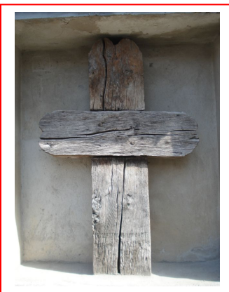
Crucea de stejar str. Fântâniței nr. 13